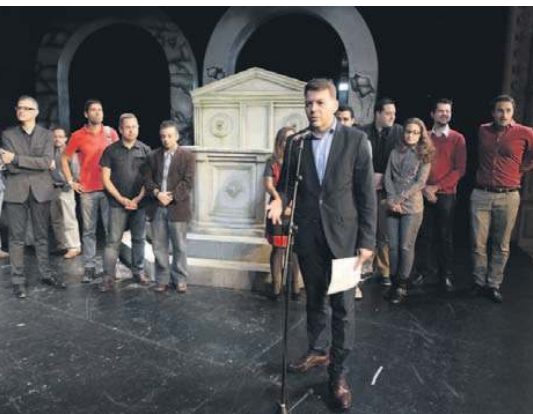
El montaje se presentó ayer en el propio escenario del Guimerá.

pectivamente, y la directora de coro Carmen Cruz Simó.