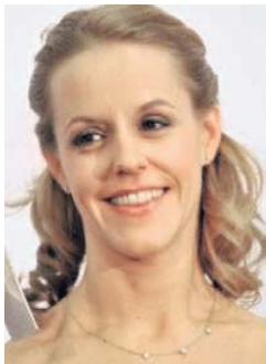
Sol Gabetta.