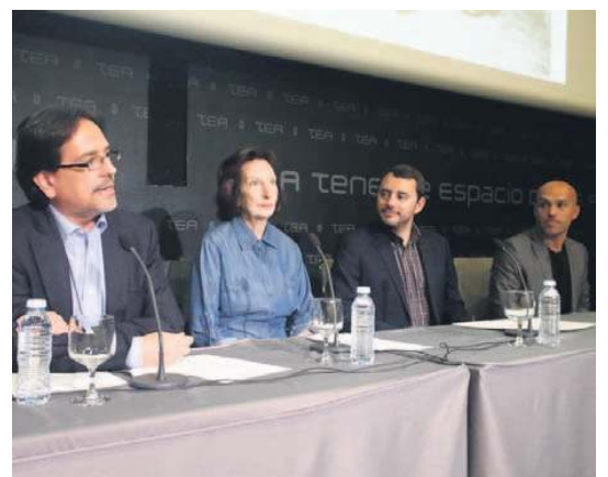
TEA acogió ayer la presentación a los periodistas de Aeroevasiones .

Para hacer Aeroevasiones ha sido necesario un exhaustivo trabajo de documentación, donde se ha recurrido a RTVE, Filmoteca Canaria, Archivo Histórico Provincial de Santa Cruz de Tenerife, Ríos TV y material de la propia artista.